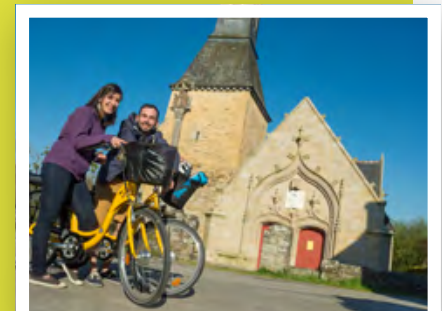
Brocéliande Bike, en partenariat avec la Destination Brocéliande a créé le réseau BROCÉLIANDE BIKE TOUR® .